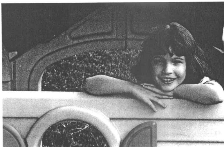
Els infants aprenen a través del joc, la seva 'feina' és jugar i ho fan de manera instintiva

La relació entre joc, necessitat i dret es conjuga i pren sentit quan parlem del procés de maduració de l'ésser humà, que, igual que molts altres animals, neix amb poques possibilitats de sobreviure, els adults són la seva única possibilitat per poder desenvolupar-se i arribar també a ser adult. Quan naixem necessi-